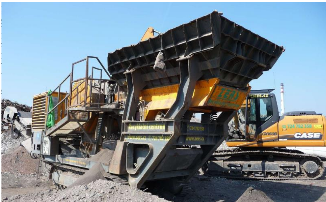
Obr. č. 4 – Drtič