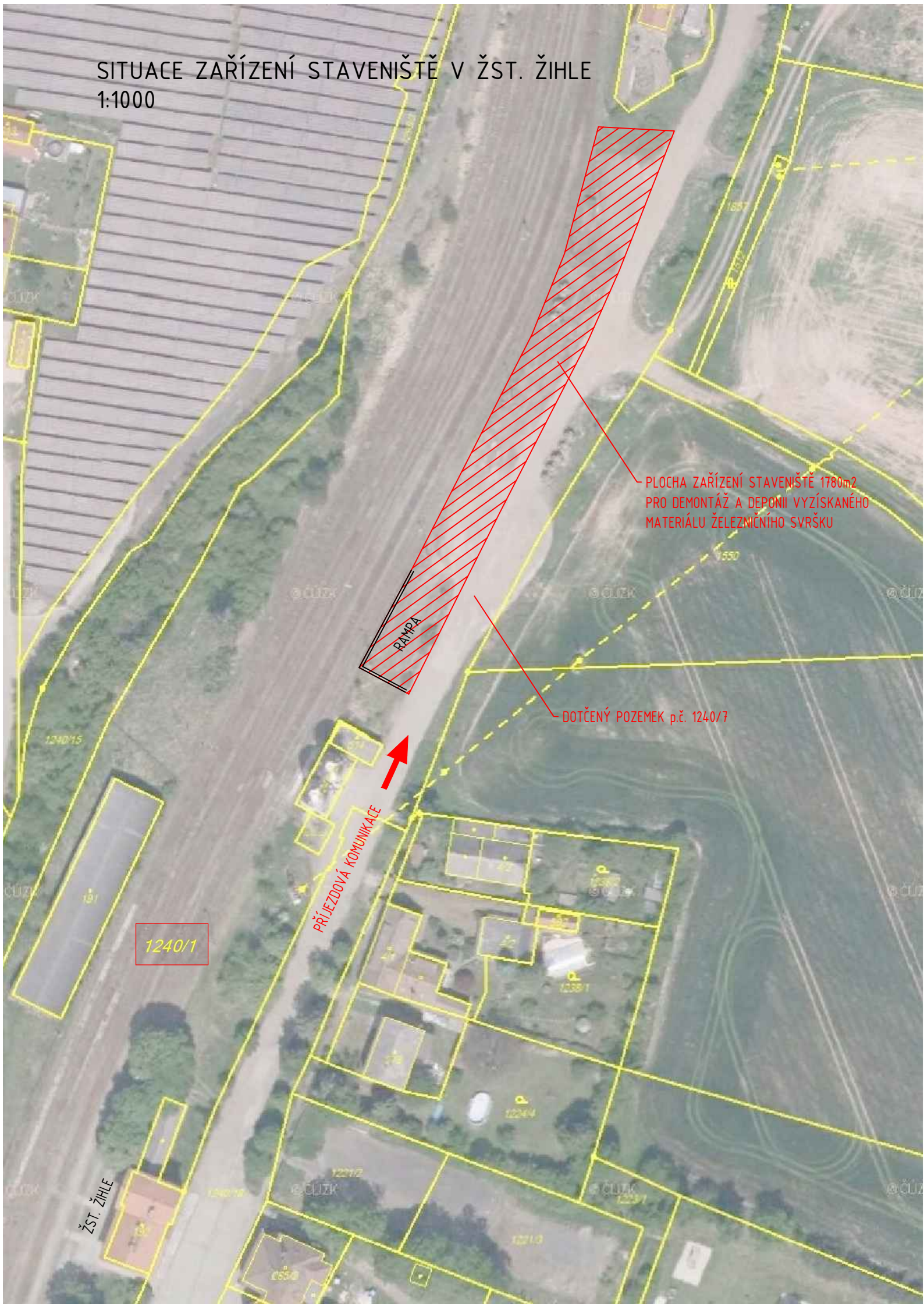
SITUACE ZAŘÍZENÍ STAVENIŠTĚ V ŽST. ŽIHLE 1:1000