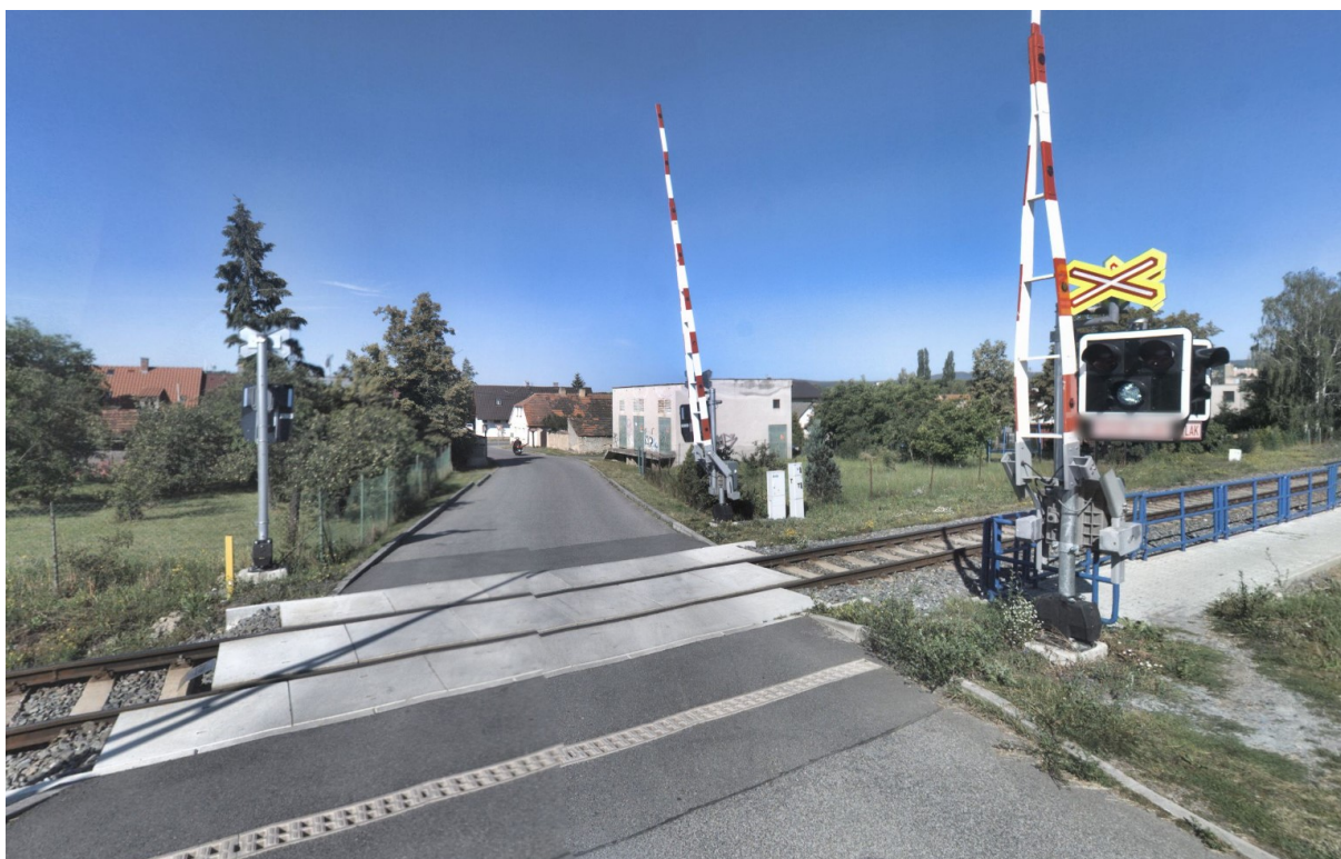
Pohled na přejezd PZS km 1,430 - místo připojení rozvaděče RP4 (z RP1)