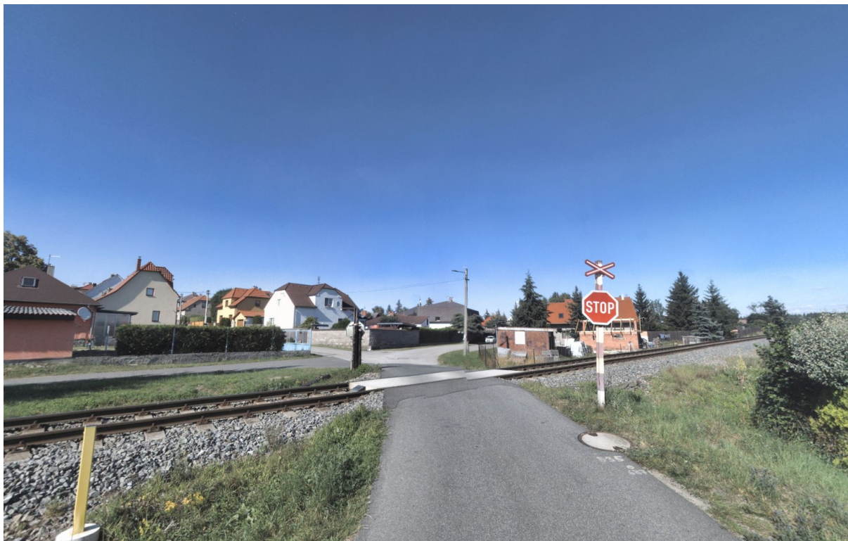
Pohled na přejezd PZS km 1,820