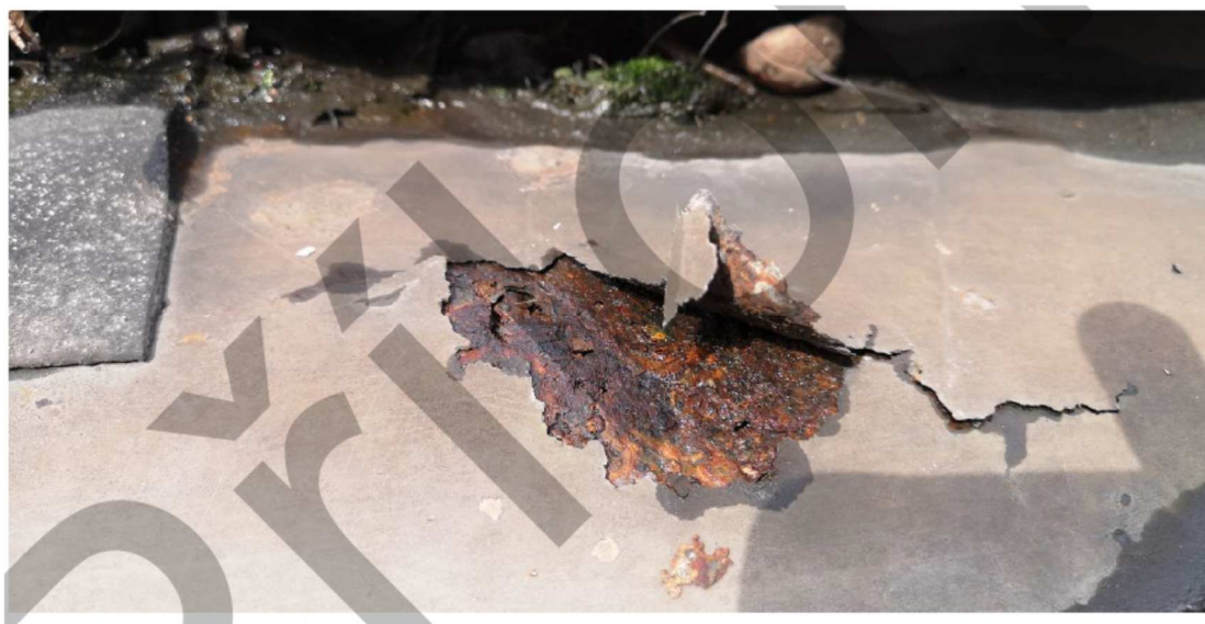
Obrázek č. 4 - Detail zkorodovaného plechového žlabu