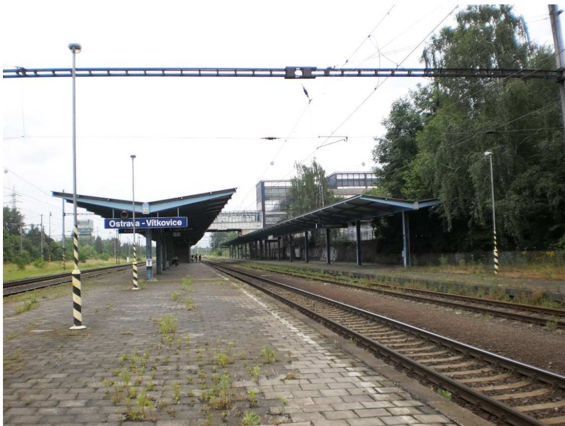
Obrázek č. 1 - Pohled na zastřešení nástupišť č. 1 a č. 2