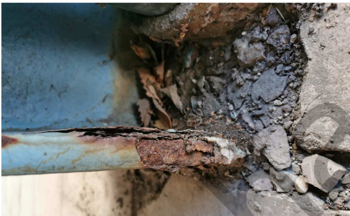
Obrázek č. 2 - Detail koroze nosné ocelové konstrukce