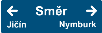
TABULE T2 - "DOPRAVNÍ SMĚRY"- NÁSTUPIŠTĚ - km 31,378