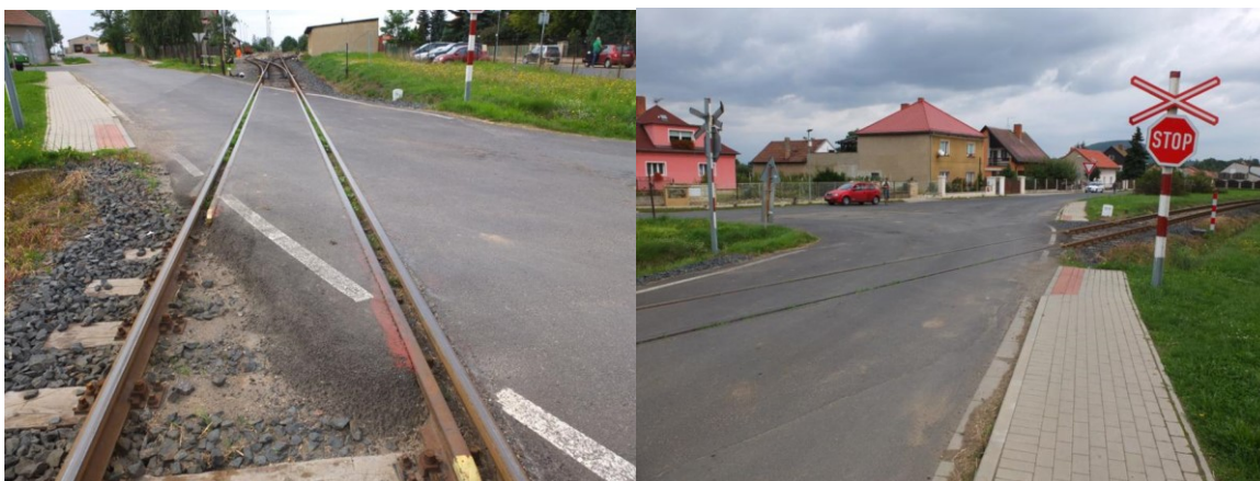
Stávající přejezd P2511 v km 22,285