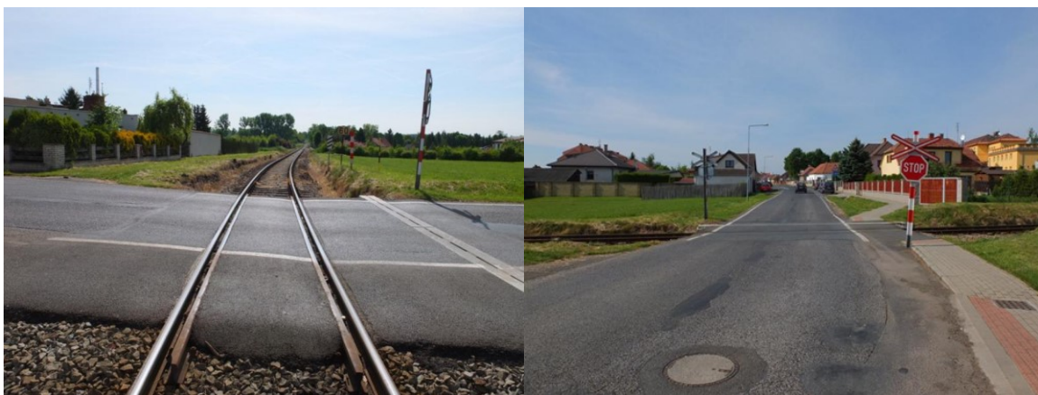
Stávající přejezd P2512 v km 22,532

Stávající přejezd v žkm 22,285 (P2511) je tvořen stejným železničním svrškem a živičnou přejezdovou konstrukcí bez odvodňovacího žlábků.