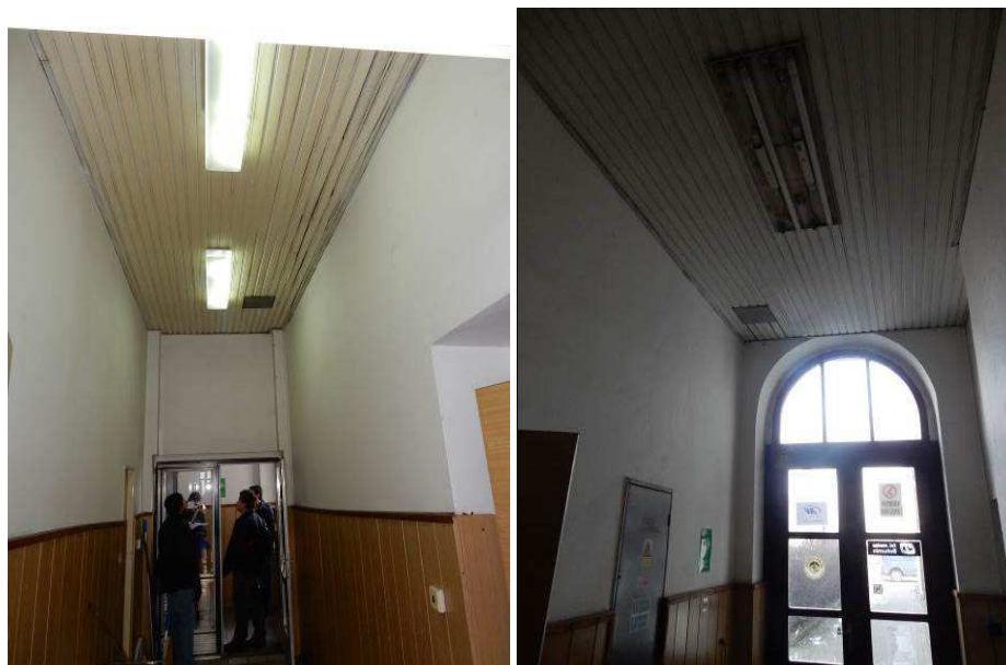
Obrázek 2: Pohled na zdvojený strop v chodbách