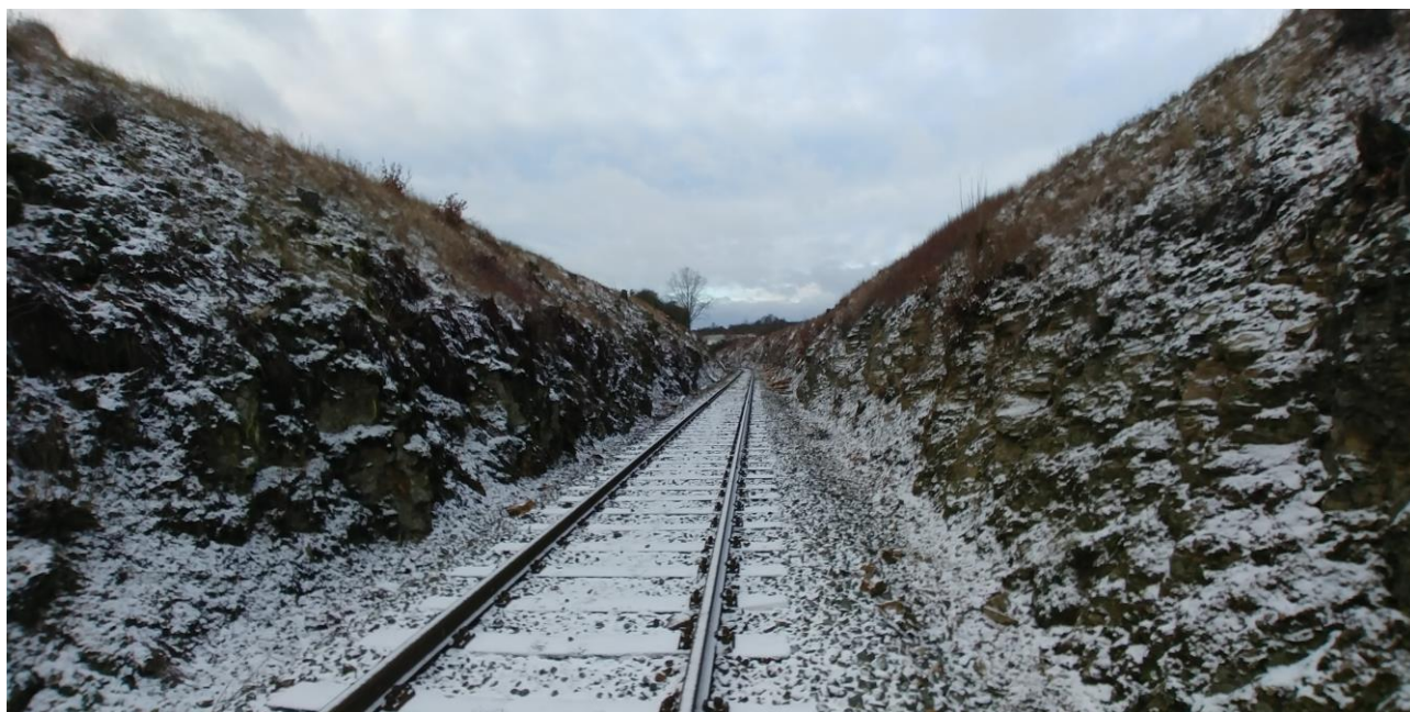
Obr. 1 – Skalní zářez v km 2,80

V této části zájmového území mají skalní výchozy sklon 60 – 85°. Droby a svory jsou v povrchové zóně silně zvětralé až úplně zvětralé, náleží do třídy R5 – R6 (dle ČSN 73 1001). Hloubka zóny zvětrání závisí na intenzitě strukturního poškození horského masívu. Hustota diskontinuit je velmi velká. Systém průběžných puklin, vzájemně kosých, způsobuje vznik kosoúhlých bloků. Nepříznivý směr diskontinuit je v pravém zářezu 20/70o a 310-330/75-85o, v levém zářezu je nepříznivý směr diskontinuit 160-180/70o. Stupeň porušení jednotlivých skalních objektů je proměnný. Skalnatý svah je po celé délce v horní polovině porostlý náletovou vegetací (odstraněná vyjma kořenového systému). Působením kořenového systému náletové vegetace dochází k postupnému rozvolňování skalního masívu. Četnost opadávání horninových úlomků a drobných řícení je velmi vysoká. V střední části výchozu je slabý výron kvartérní podzemní vody. Vydatnost je závislá na atmosférických srážkách. V oblasti výronu je hornina zcela rozložená.