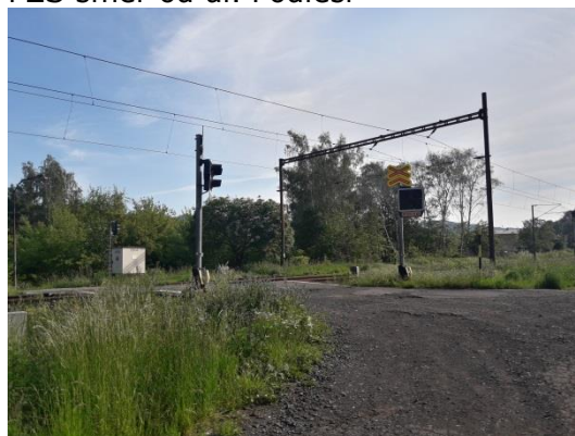
PZS směr od ul. Podlesí