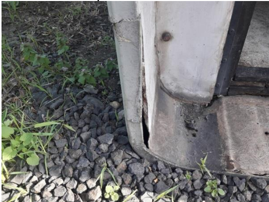
PZS detail rozpadlé části rel. Domku