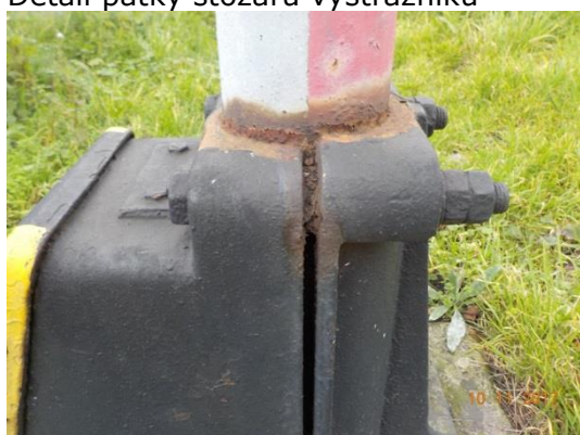
Detail patky stožáru výstražníku