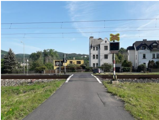
PZS směr od Svádova