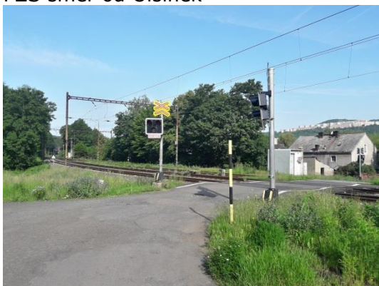
PZS směr od Olšinek