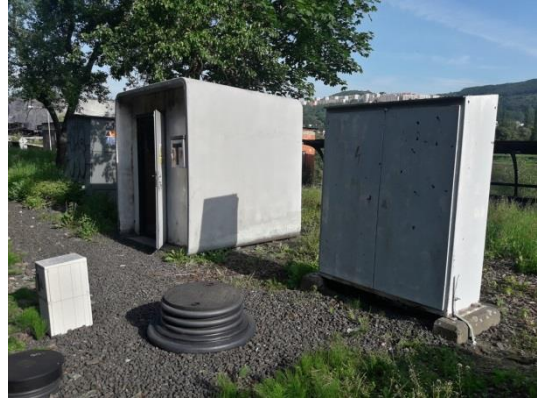
PZS umístění technologie