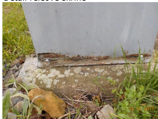
Detail reléové skříně