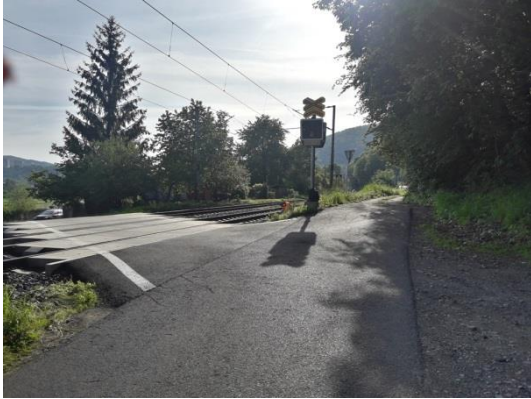
PZS směr od ul. K Loděnici