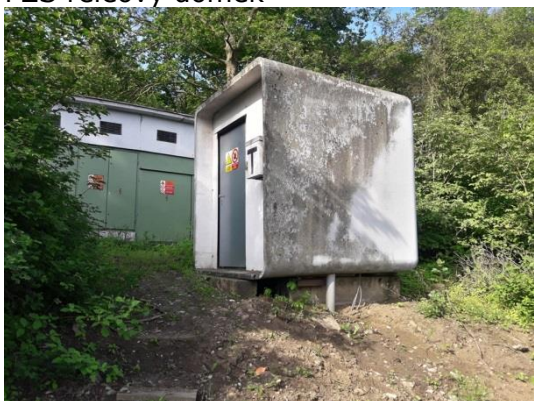
PZS reléový domek