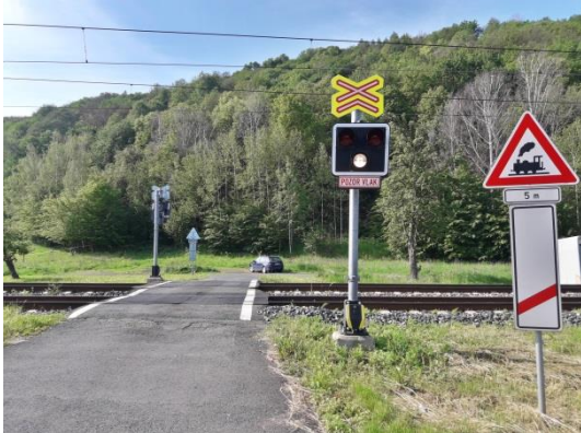
PZS směr od ul. Vítězná