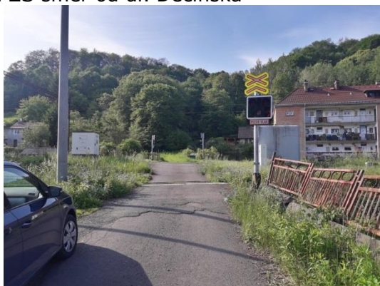
PZS směr od ul. Děčínská