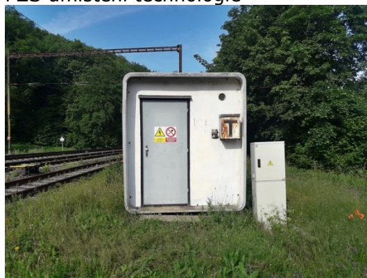
PZS umístění technologie