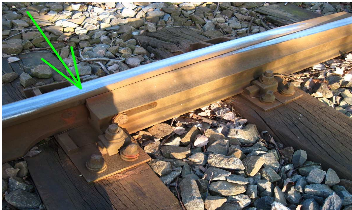
začátek jazýkové kolejnice (hrot DZ)