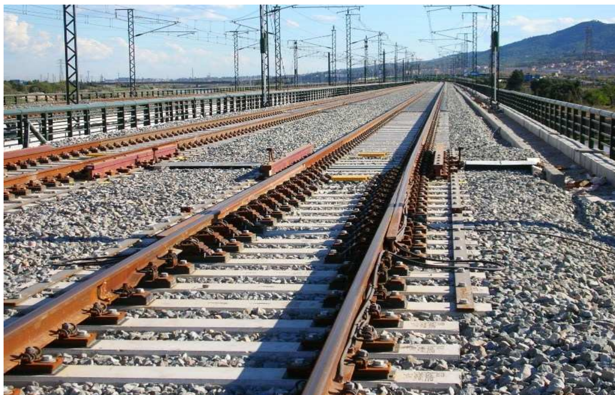
příklad správné fotodokumentace DZ – fotografie musí být vždy pořízena ve směru staničení