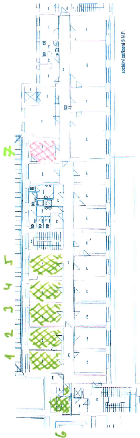
sociální zařízení 3.N.P.