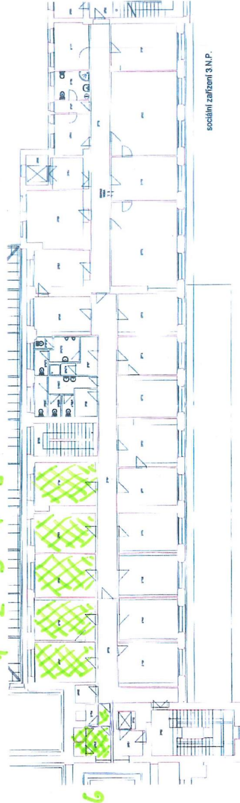
sociální zařízení 3.N.P.