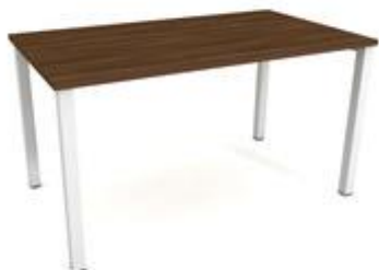
13) Stůl jednací č. 2, ilustrační obrázek