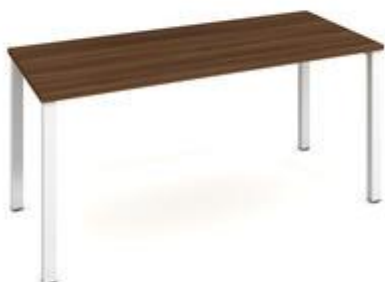
14) Stolek přídatný levý, ilustrační obrázek