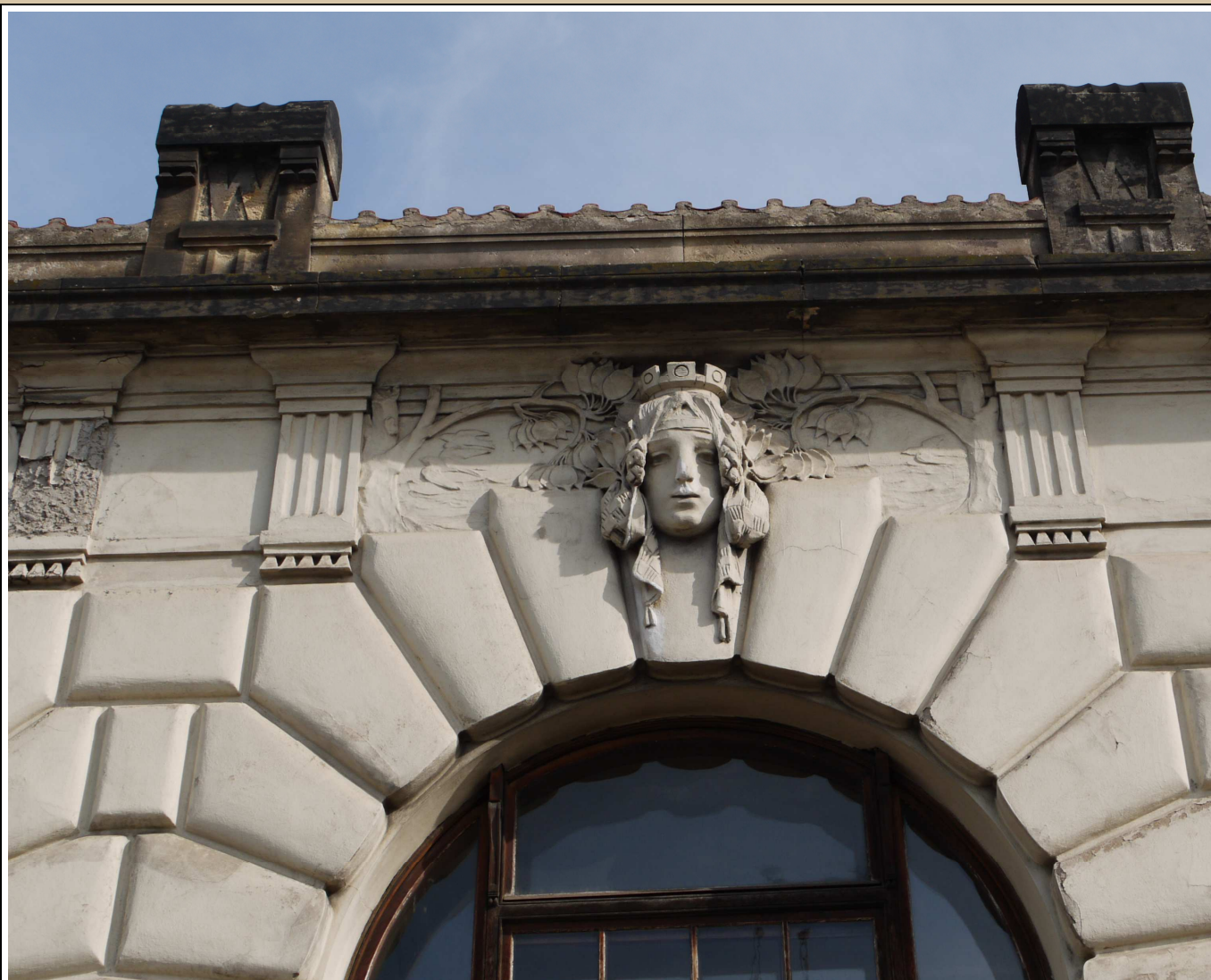
maskaron v klenáku okna stav v roce 2017