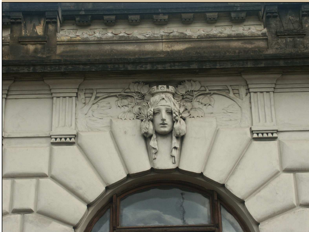
maskaron v klenáku okna v roce 2004