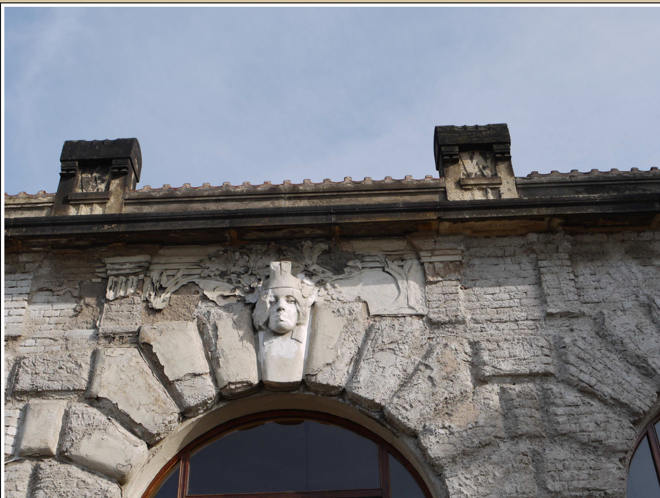
maskaron v klenáku okna stav v roce 2017