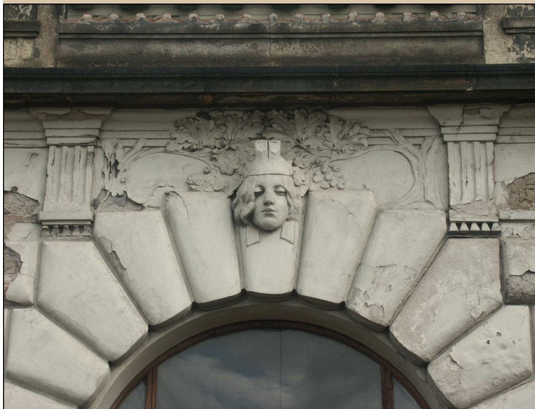
maskaron v klenáku okna stav v roce 2004