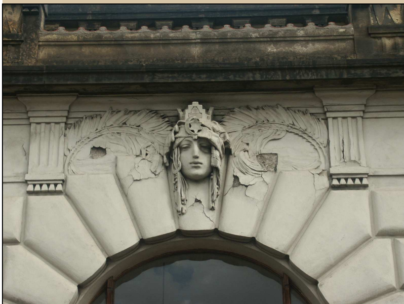
maskaron v klenáku okna stav v roce 2004