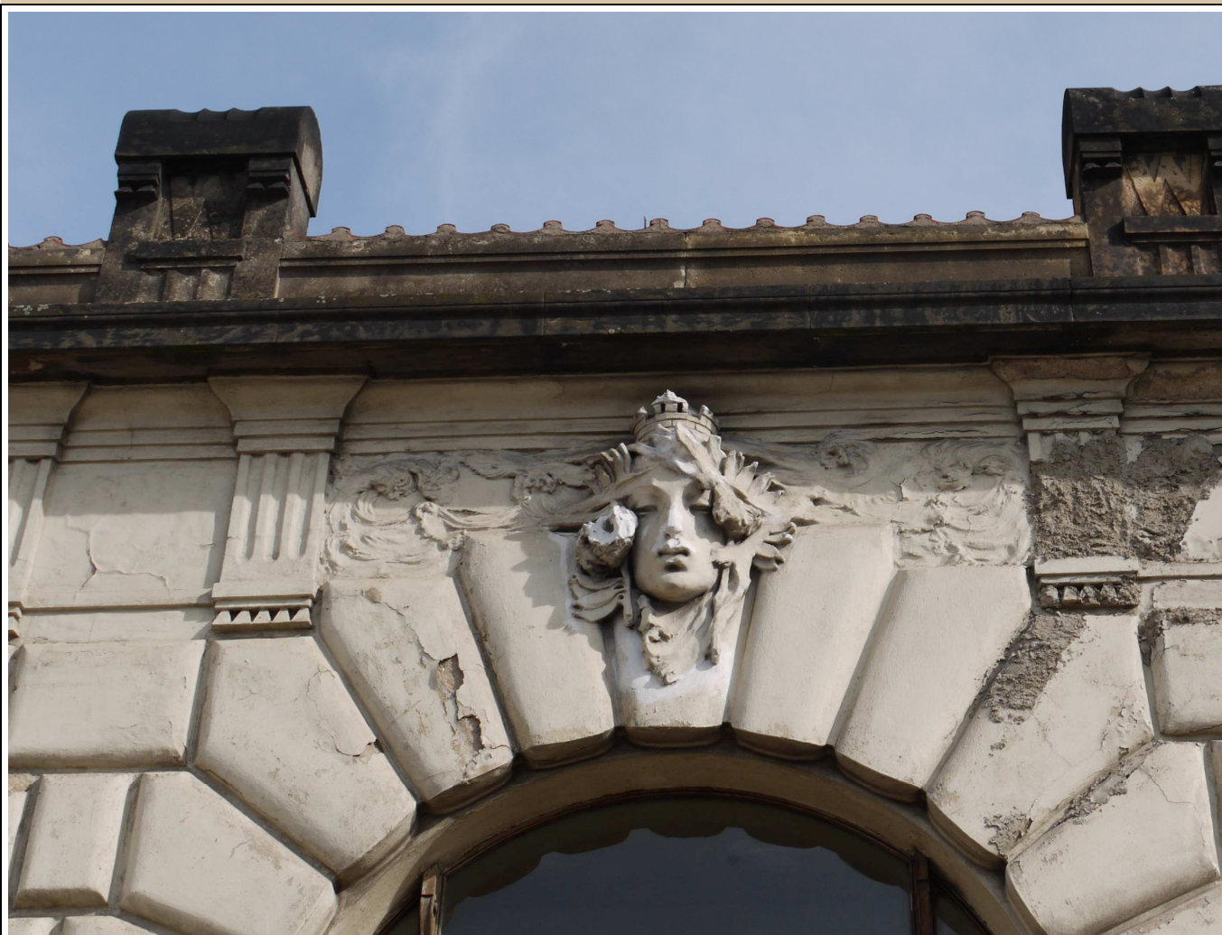
maskaron v klenáku okna stav v roce 2017