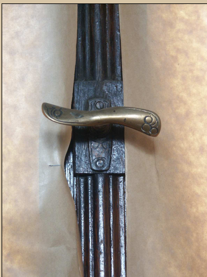
klička, původní secesní