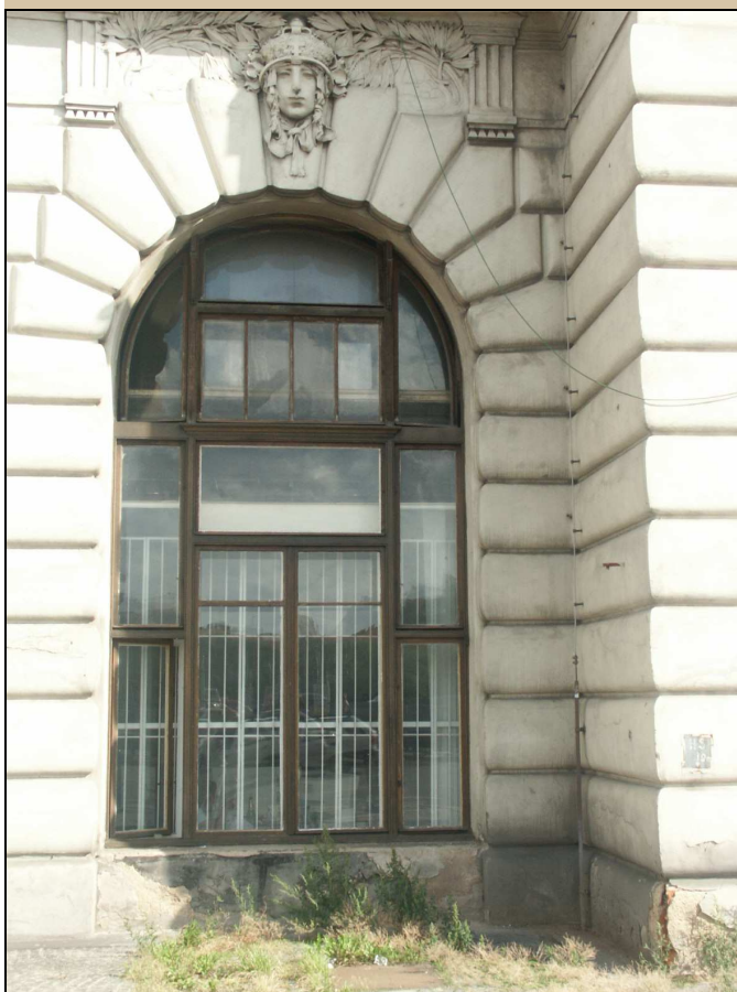
pohled na okno z exteriéru