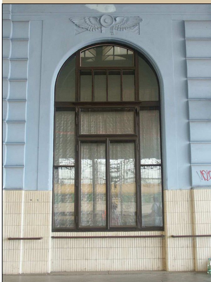
pohled na okno z perónu