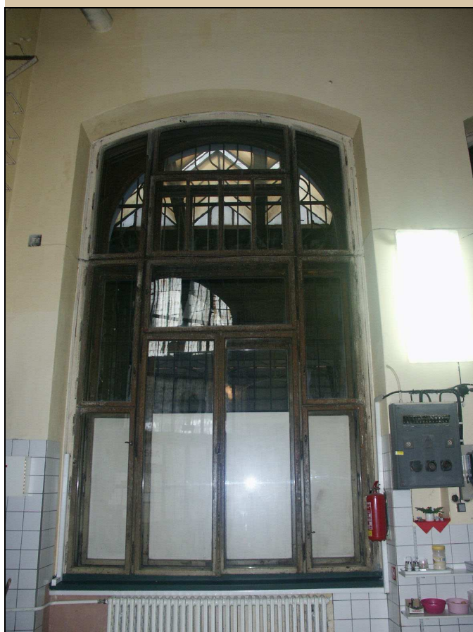
varianta okna z interiéru ukončena segmentem