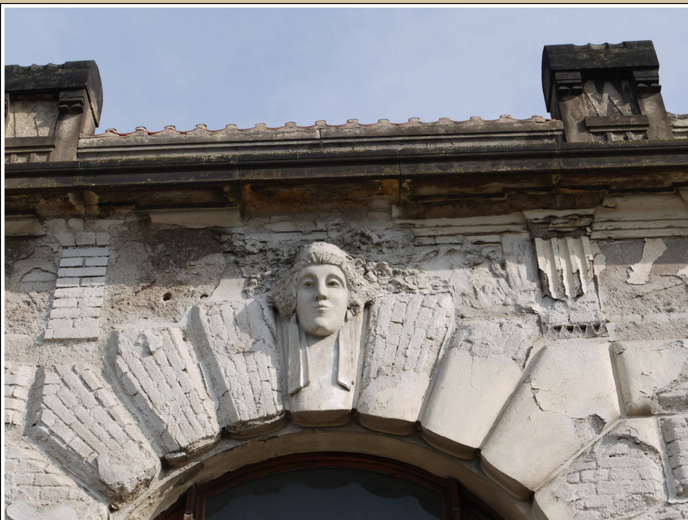
maskaron v klenáku okna stav v roce 2017