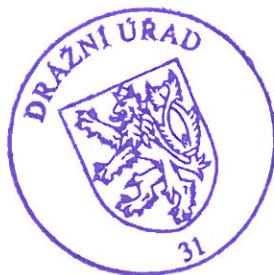
Ing. Miroslav Hron ředitel územního odboru Praha

Proti tomuto rozhodnutí může účastník řízení podat odvolání podle § 81 odst. 1. zákona č. 500/2004 Sb., správní řád, ve znění pozdějších předpisů (dále jen "správní řád"), ve lhůtě 15 dnů ode dne jeho oznámení, k Ministerstvu dopravy, podáním učiněným u Drážního úřadu, sekce stavební - územní odbor Praha, Wilsonova 300/8, 121 06 Praha. Odvolání jen proti odůvodnění rozhodnutí je podle § 82 odst. 1 správního řádu nepřípustné . Odvolání se podává s potřebným počtem vyhotovení tak, aby jeden stejnopis zůstal správnímu orgánu, a aby každý účastník dostal jeden stejnopis. Nepodá-li účastník potřebný počet stejnopisů, vyhotoví je Drážní úřad na náklady účastníka.