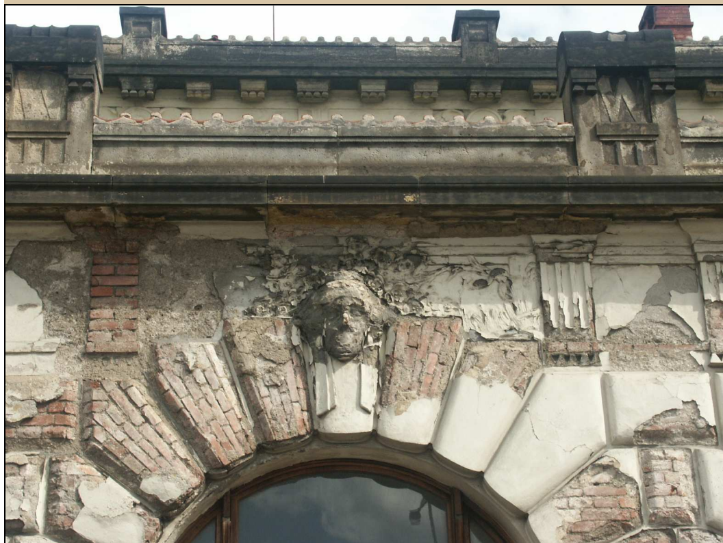
maskaron v klenáku okna stav v roce 2004