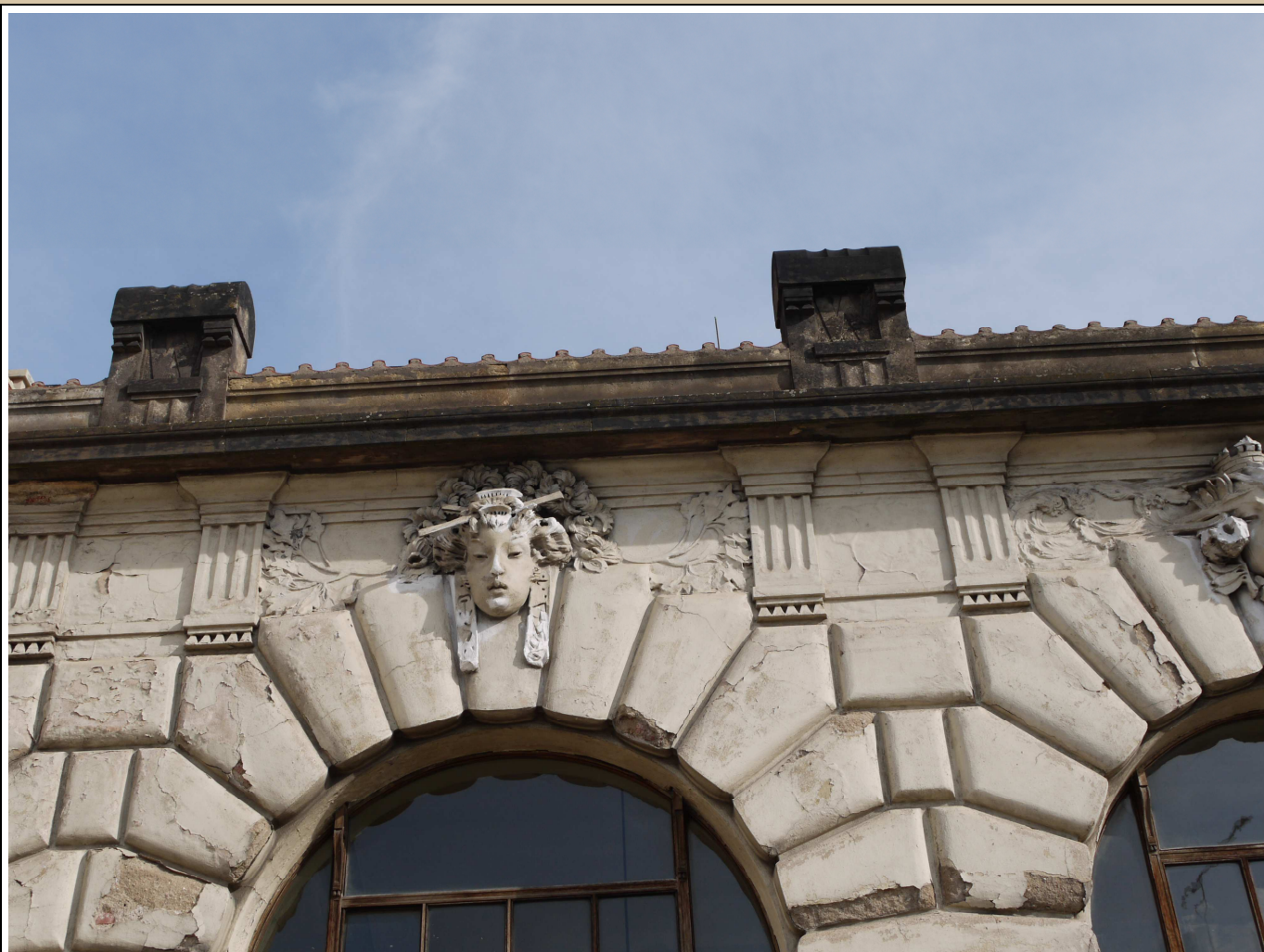
maskaron v klenáku okna stav v roce 2017