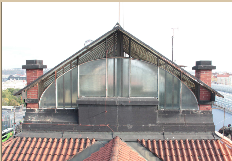
pohled na světlík od jihu

Nutno restaurovat restaurátorem s licenci Ministerstva kultury ČR. Světlík bude částečně demontován a odvezen do restaurátorské dílny, kde bude očištěn od novodobých nátěrů a nečistot. Budou doplněny chybějící části. Bude provedena nová povrchová úprava s krycím nátěrem. Odstín bude shodný jako u kovových prvků na části C.