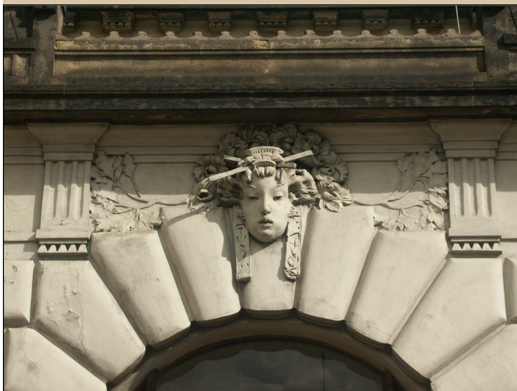
maskaron v klenáku okna stav v roce 2004