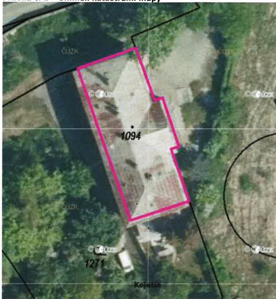
Příloha č. 1 – Snímek katastrální mapy