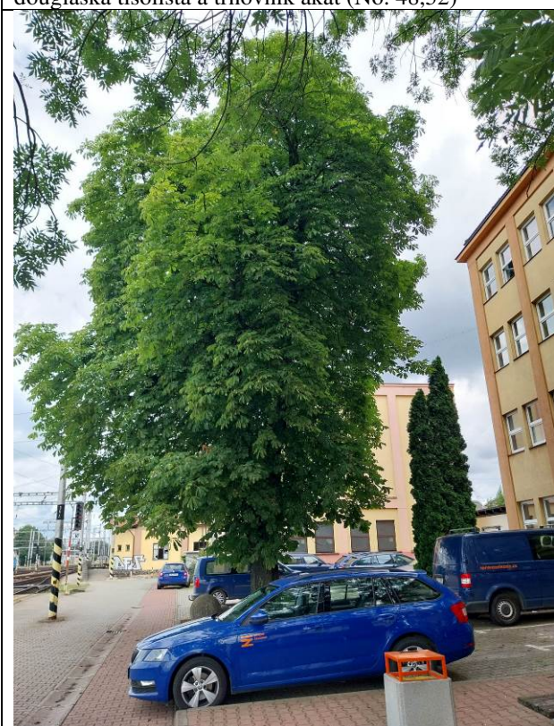
jírovec maďal (No. 159)