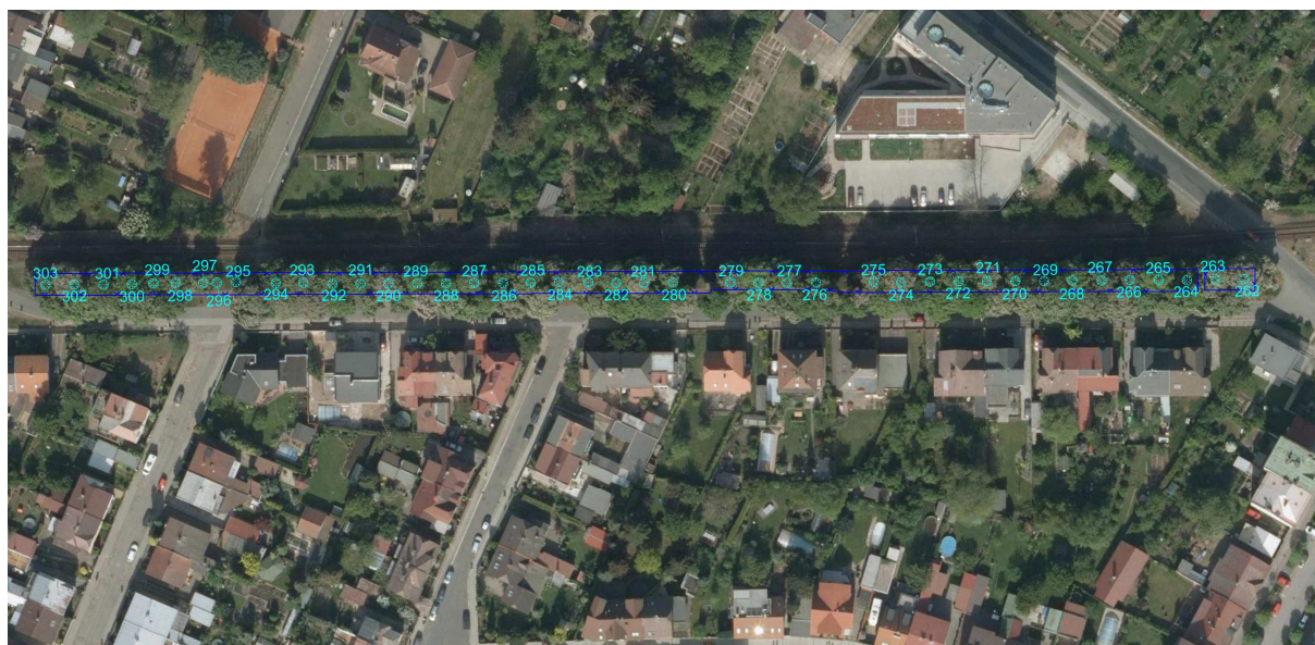
Obr. Oplocení první řady Kaštanky, mezi dřevinou 263 a 264 zůstane místo pro průjezd

V Opatovické ulici bude chráněna první řada jírovců maďalů (tzv. Kaštanka), celkem 42 dřevin, která je v kolizi s kabelovou trasou zabezpečovacího zařízení. V Gočárově třídě budou chráněny platany v záboru stavby. Oplocení větších skupin stromů bude provedeno pevně ukotvenými stavebními dílci (ponechání průjezdů pro mechanizaci), po ukončení stavby dojde k provzdušnění v místech pojezdu.