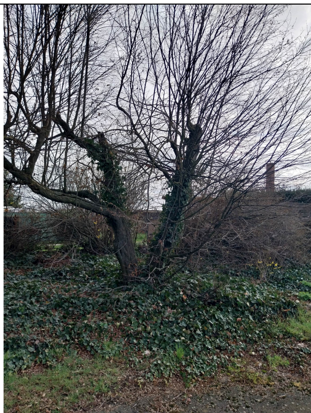
habr obecný (No. 218)