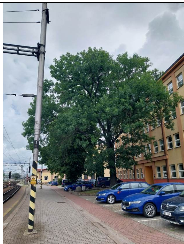
jasan ztepilý (No. 158)