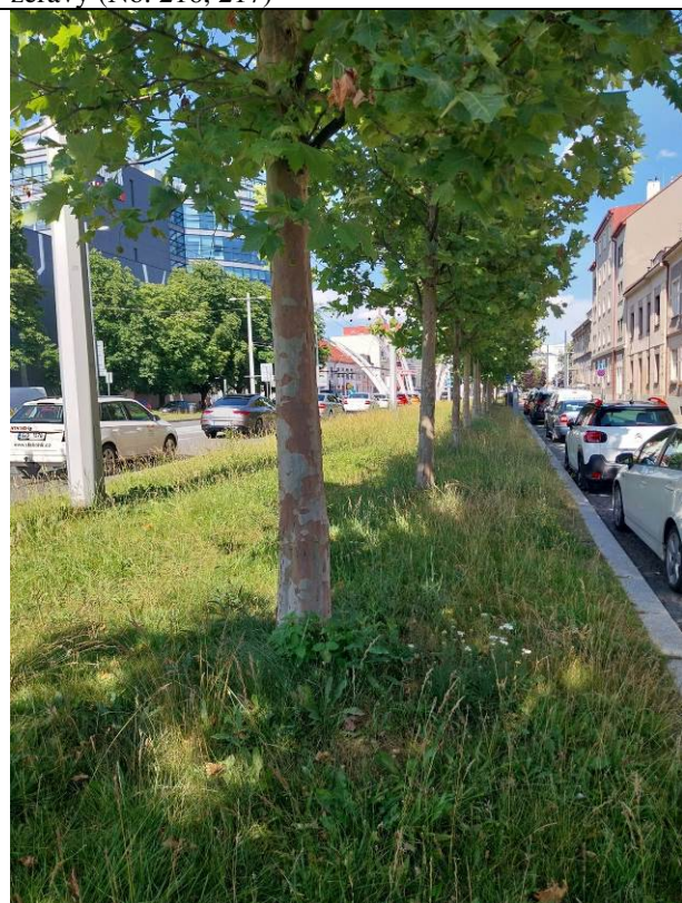
platany (No. 82a-82h) v Gočárově