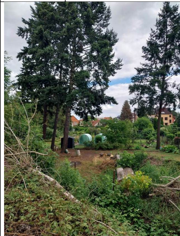
douglasky tisolisté, pouze vlevo (No. 25-27)