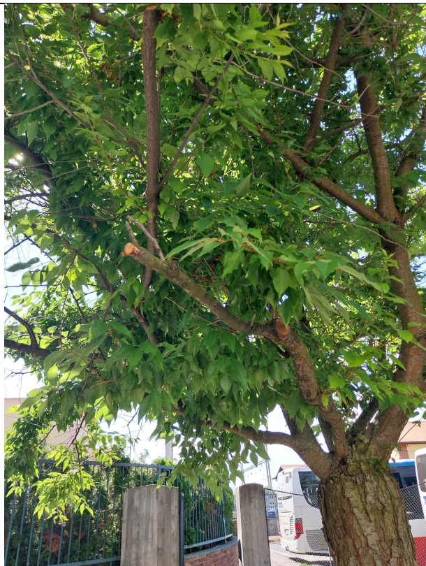
jaro 2024 – stromy již byly výrazně ořezány