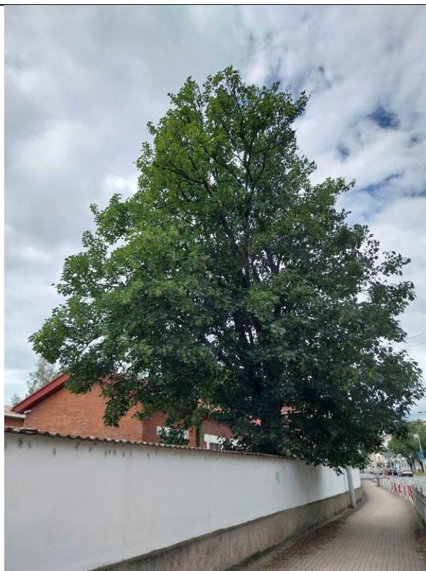
javor klen (No. 64)