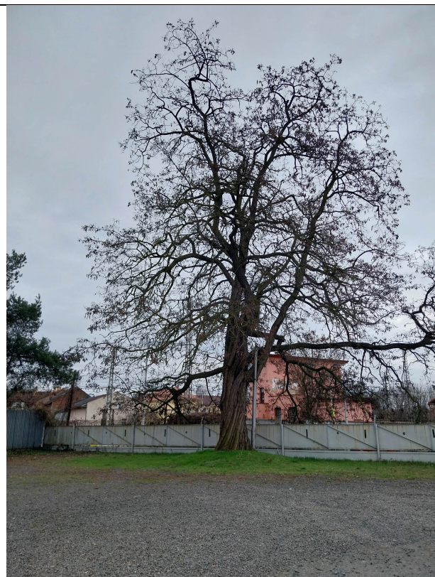
trnovník akát (No. 67)