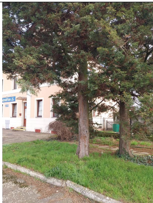
zeravy (No. 216, 217)