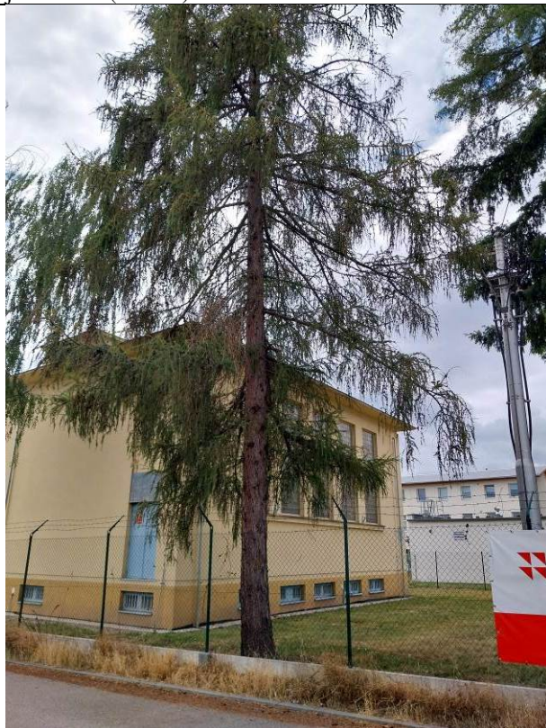
modřín opadavý (No. 48 b)