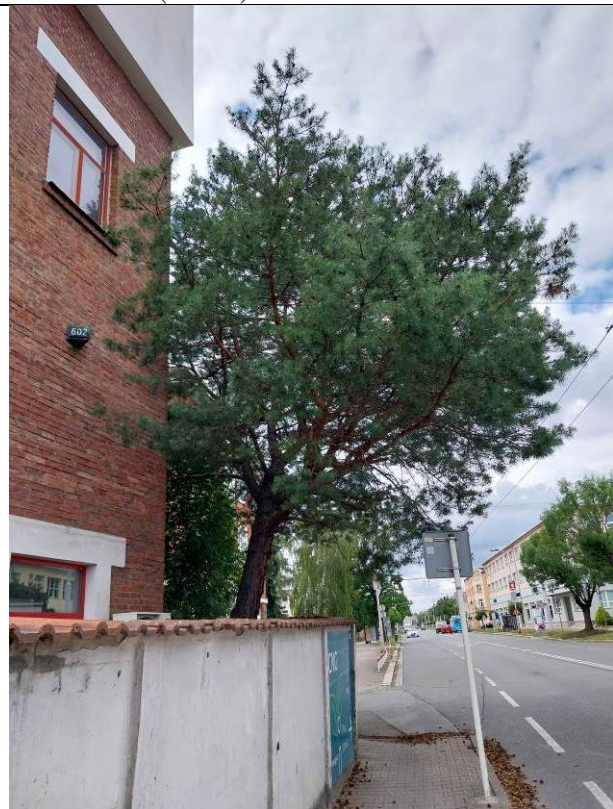
borovice lesní (No. 62)