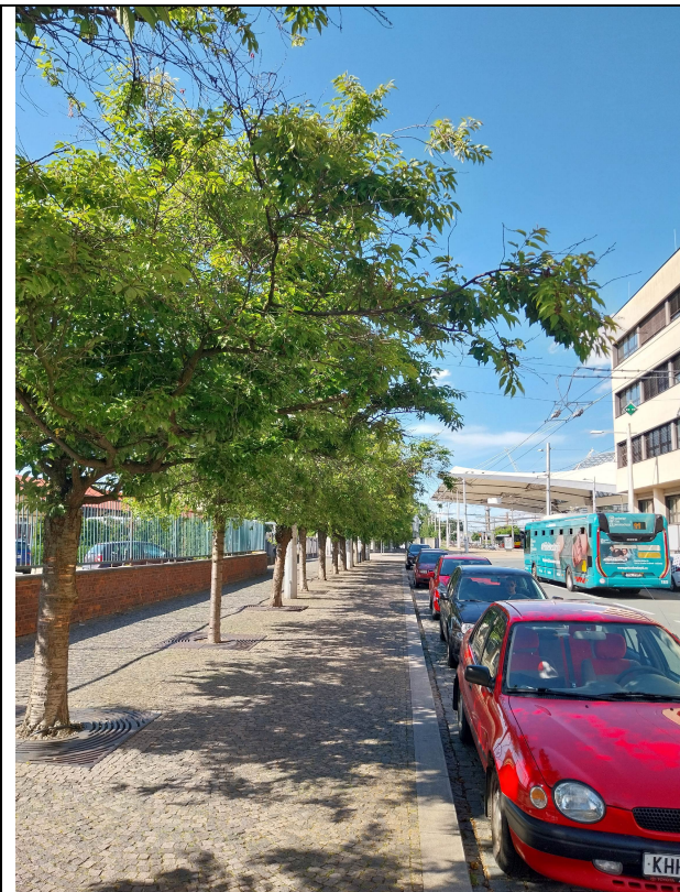
ulice Sladkovského - přesah některých menších větví Prunus subhirtella přes hranu obrubníku