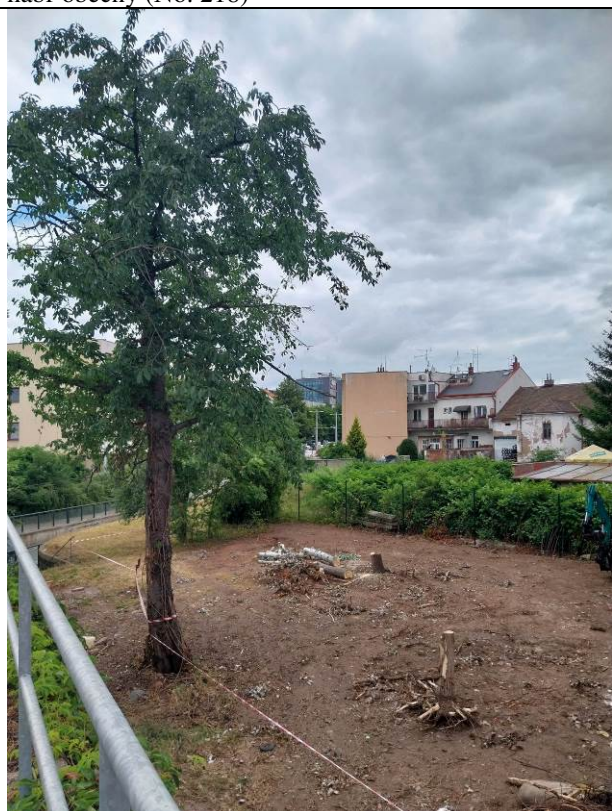
třešeň ptačí (No. 72)