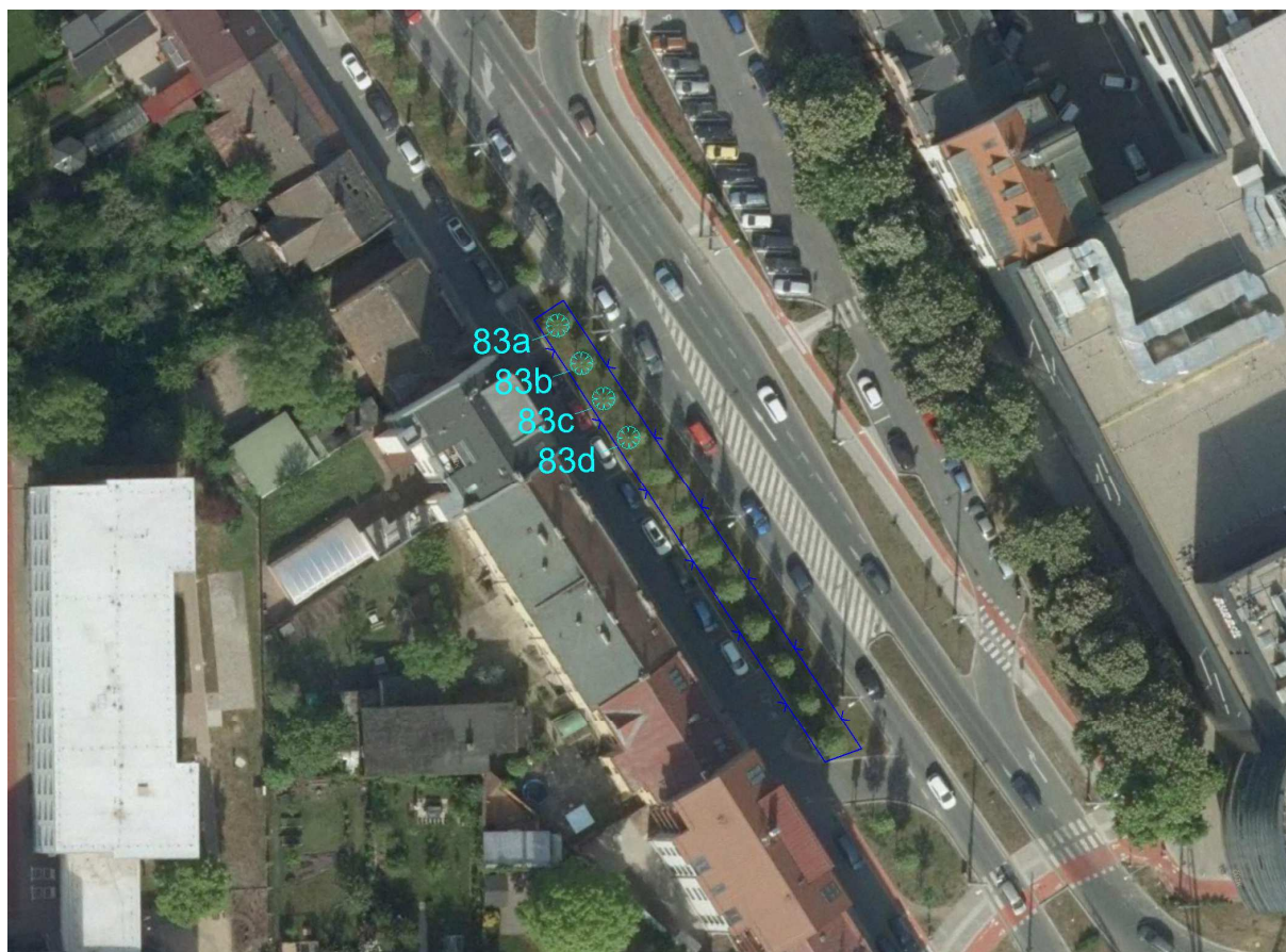
Obr. Oplocení platanů – Gočárova třída