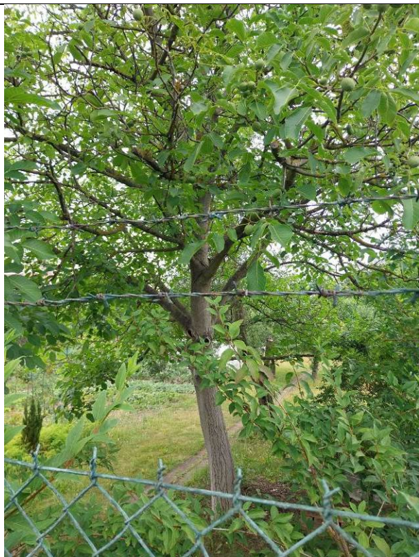
ořešák královský (No. 6)