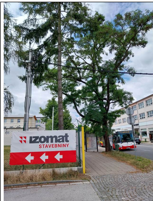
douglaska tisolistá a trnovník akát (No. 48,52)