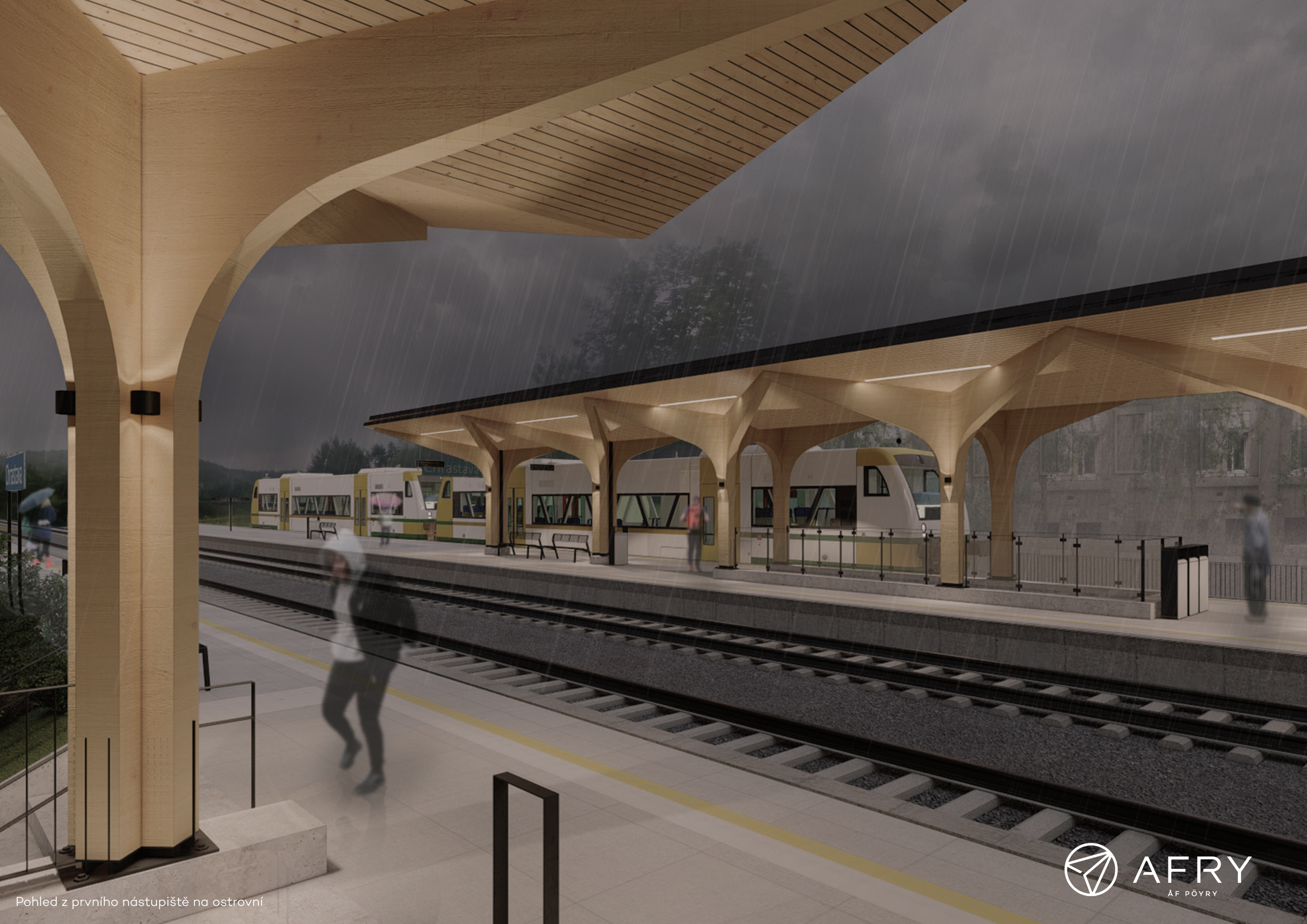
Pohled z prvního nástupiště na ostrovní