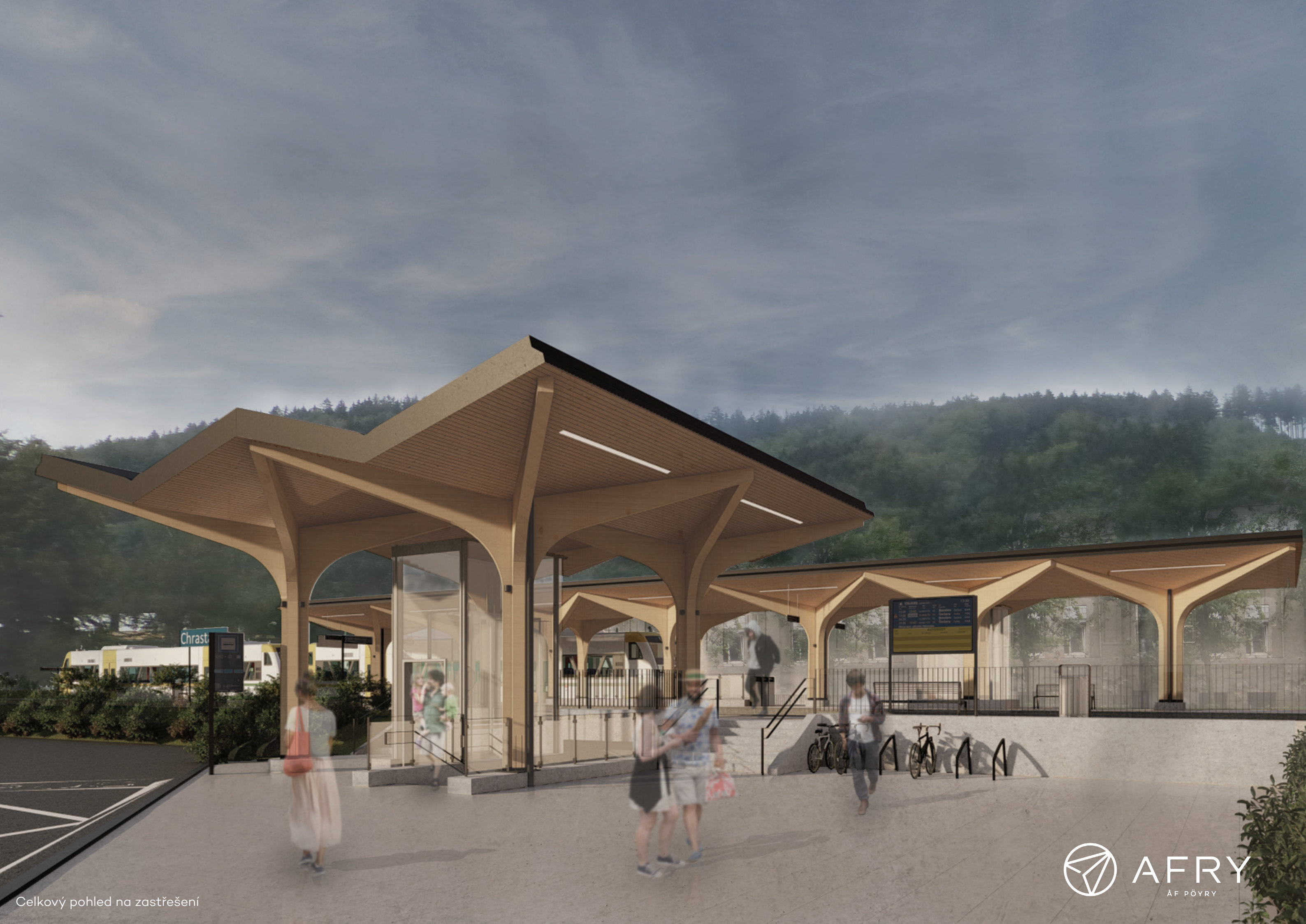
Celkový pohled na zastřešení