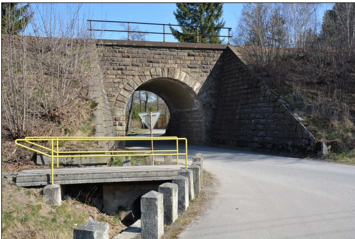
Obrázek 10 – Železniční zastávka Hamry nad Sázavou, most sloužící též pro přístup na nástupiště u koleje č. 2