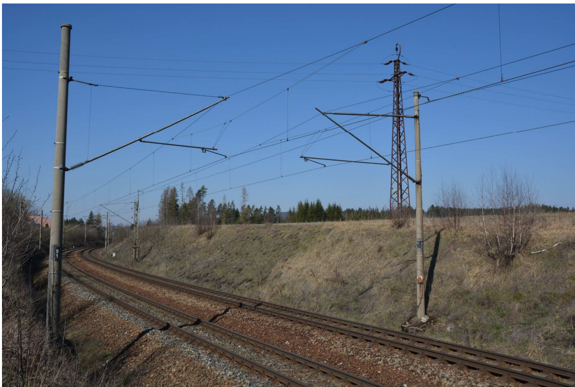
Obrázek 5 – Zářez km 89,900, místo navrženého posunu osy koleje vpravo, pohled ze směru od Žďáru n. S.