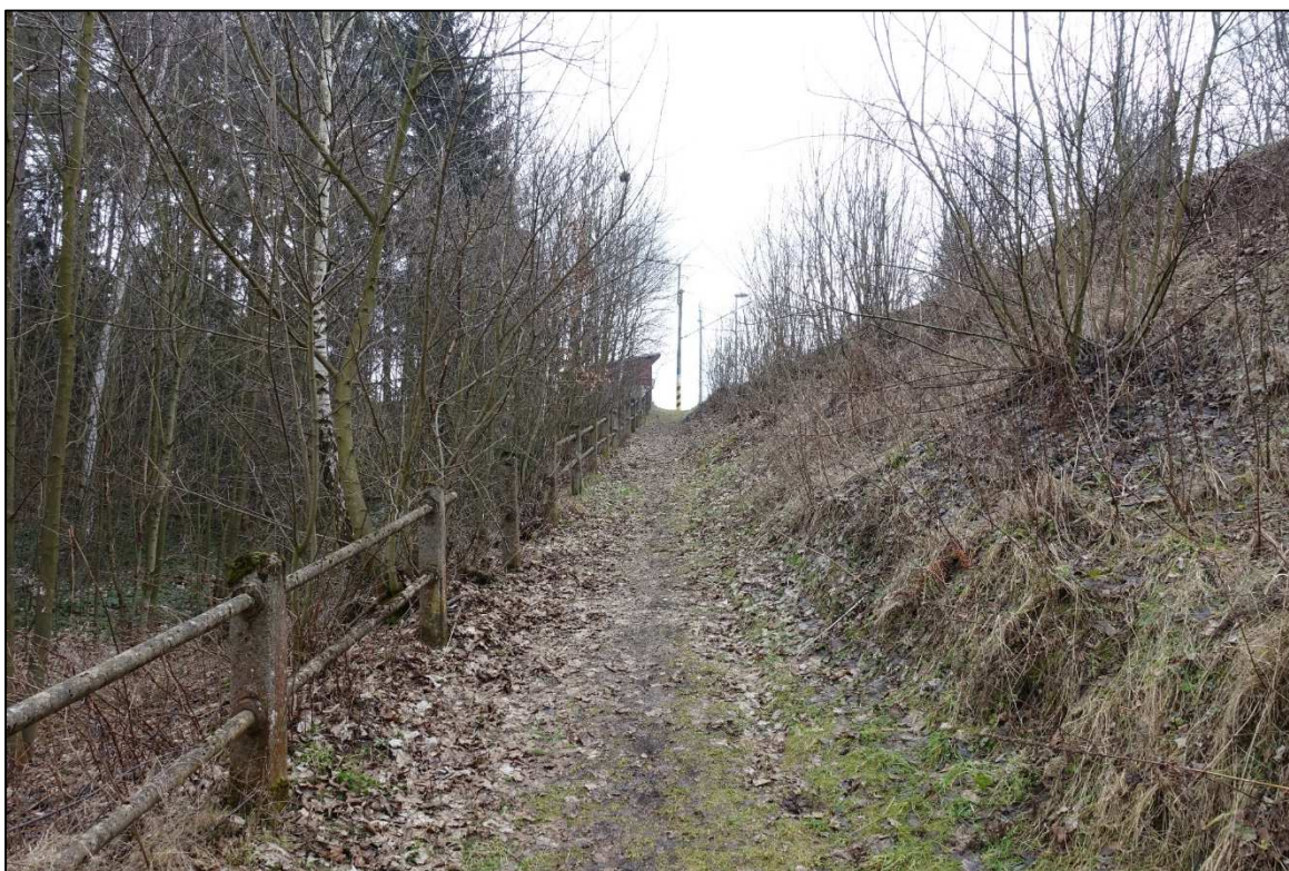
Obrázek 9 – Železniční zastávka Hamry nad Sázavou, přístup na nástupiště u koleje č. 2