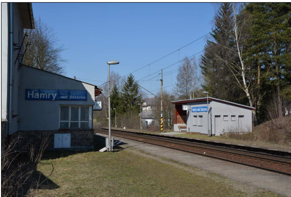
Obrázek 7 – Železniční zastávka Hamry nad Sázavou, nástupiště, vlevo u 1. TK přístavba bývalé hlásky u obytné budovy, vpravo u 2. TK přístřešek