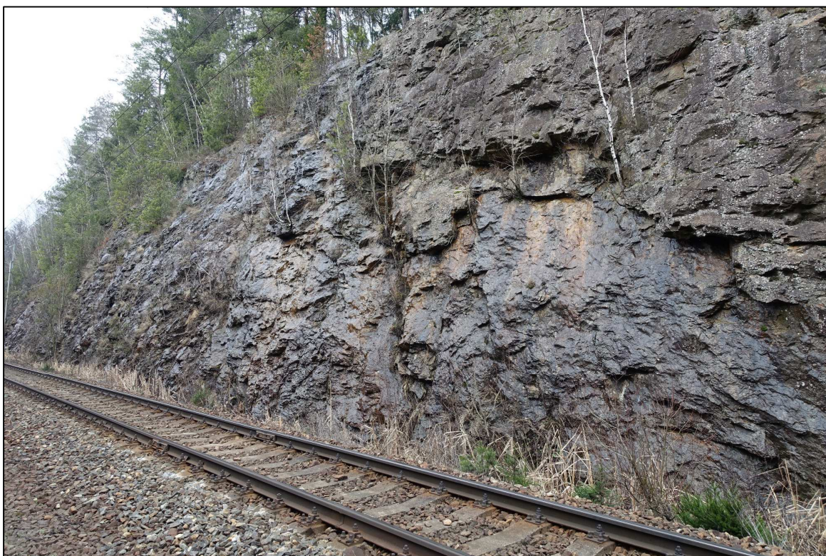
Obrázek 17 – Skalní svah vpravo trati km 92,500