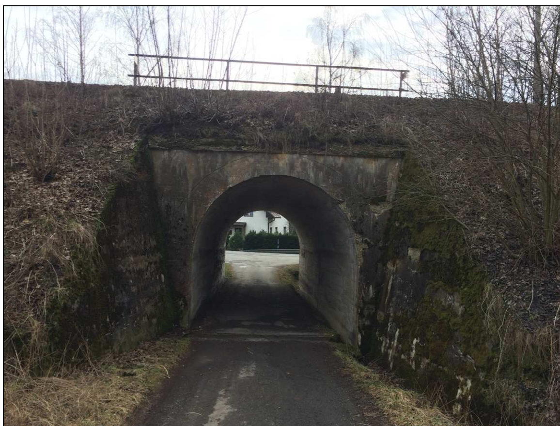
Obrázek 4 – železniční most v km 89,699