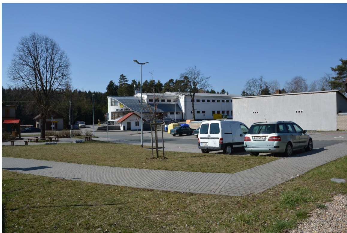
Obrázek 8 – Železniční zastávka Hamry nad Sázavou, přednádraží – parkoviště, obecní úřad