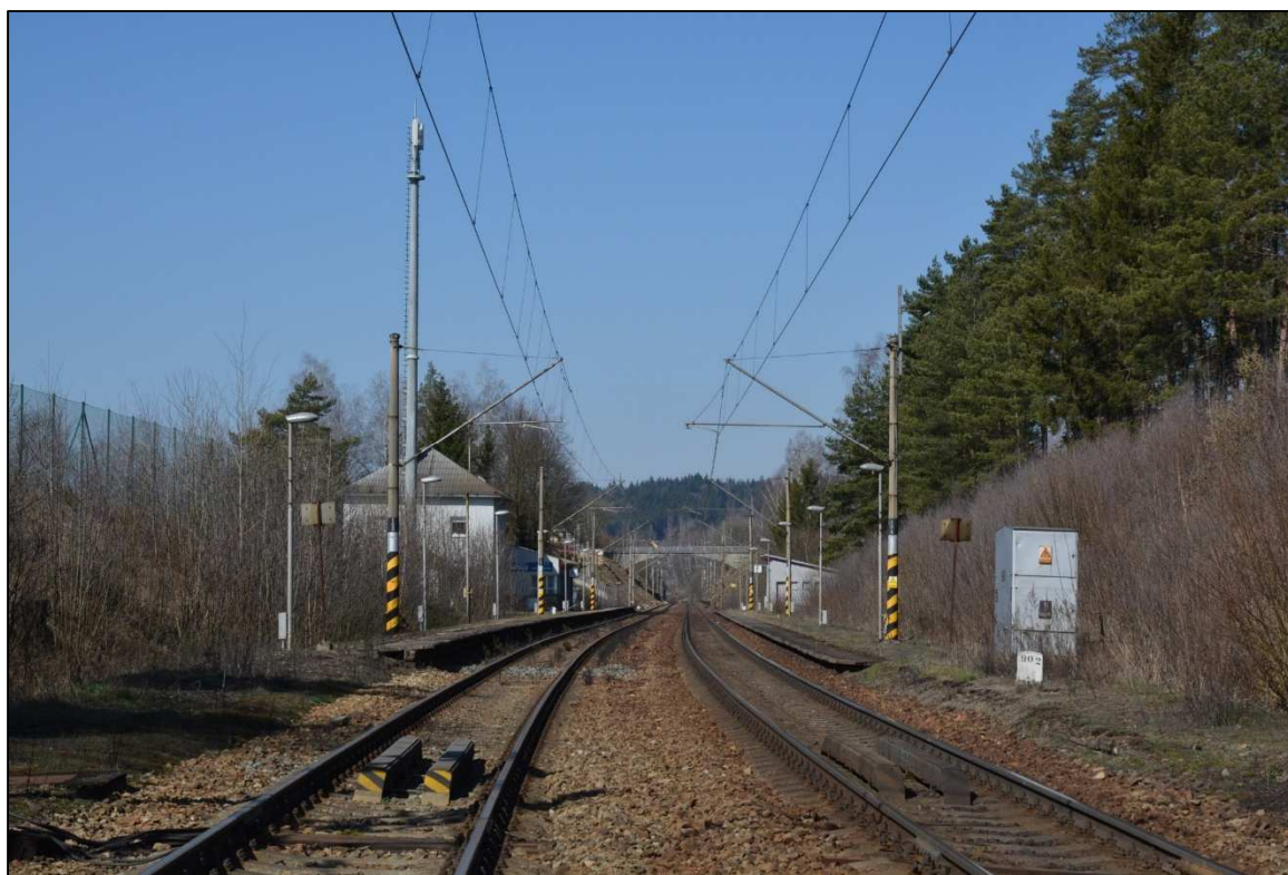
Obrázek 6 – Železniční zastávka Hamry nad Sázavou, vlevo obytný objekt a stožár BTS, pohled od směru Žďár n. S.