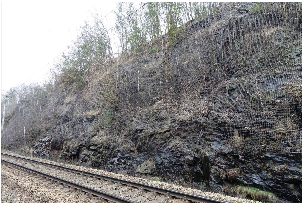
Obrázek 13 – Skalní svah vpravo trati km 90,950 s již zdegradovanými ochrannými sítěmi