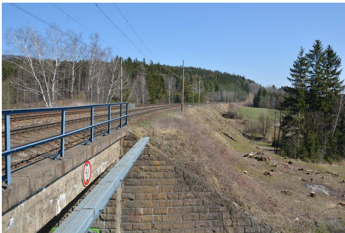
Obrázek 18 – Železniční násep u mostu v km 93,176, pohled ze směru Sázava u Ž. na prostor navrženého směrového posunu koleje na náspu