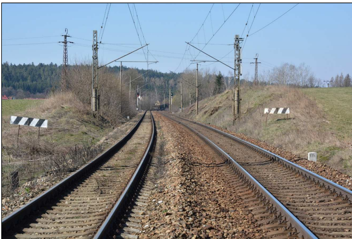
Obrázek 2 - zářez v km 89,400, pohled ze směru Žďár nad Sázavou