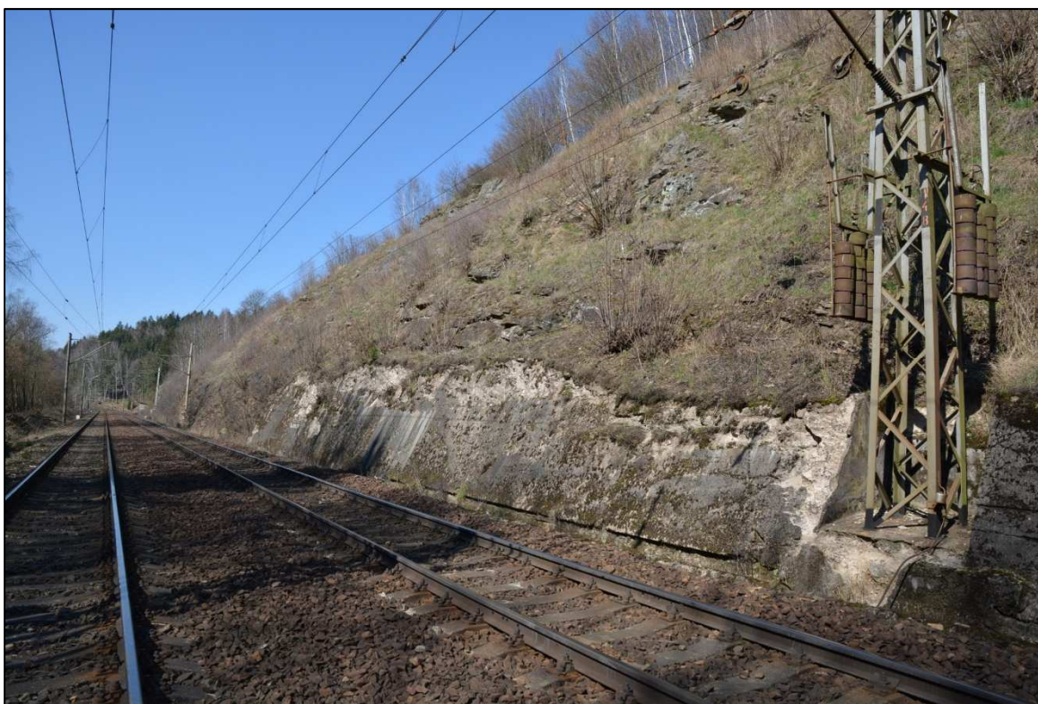
Obrázek 16 – Betonová obkladní zed' se zcela zdegradovaným povrchem km 91,800