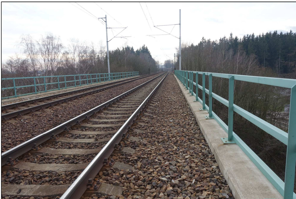
Obrázek 1 - Železniční most přes řeku Sázavu v km 88,069, pohled ze směru Sázava u Žďáru