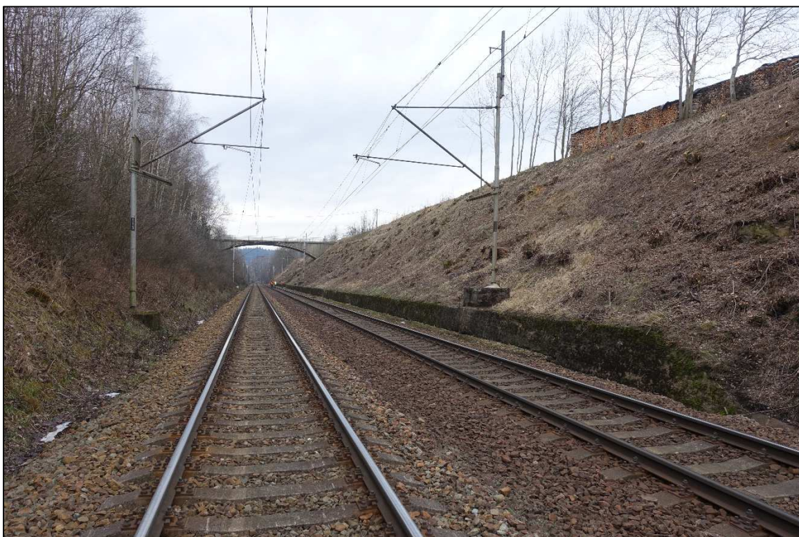
Obrázek 11 – Železniční zářez v km 90,6, vpravo betonová monolitická zárubní zeď s integrovaným žlabem, pohled ze směru Žďár n. S.