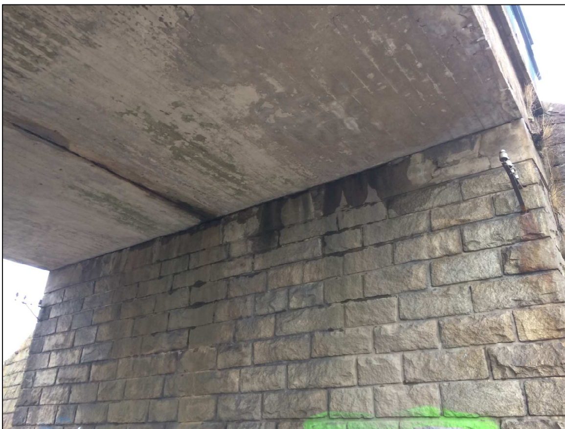
Obrázek 19 - Detail železničního mostu v km 93,176