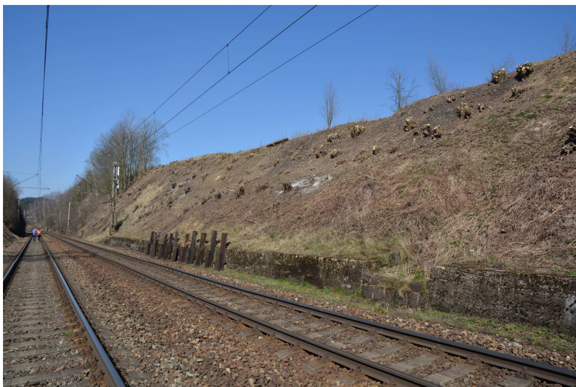
Obrázek 12 – Železniční zářez v km 90,800, vpravo betonová monolitická zárubní zeď s integrovaným žlabem, porušená sesuvem svahu a nouzově rozepřená dřevěnými pražci, pohled ze směru Žďár n. S.