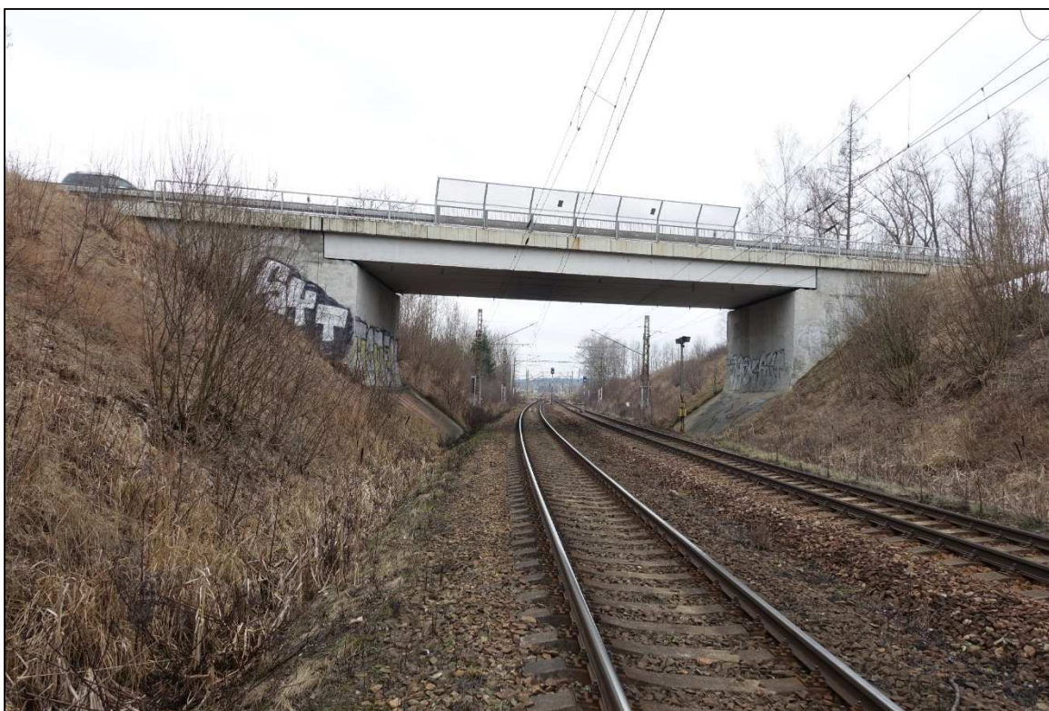
Obrázek 20 - Konec traťového úseku před železniční stanicí Sázava u Žďáru v km 93,700 se silničním nadjezdem