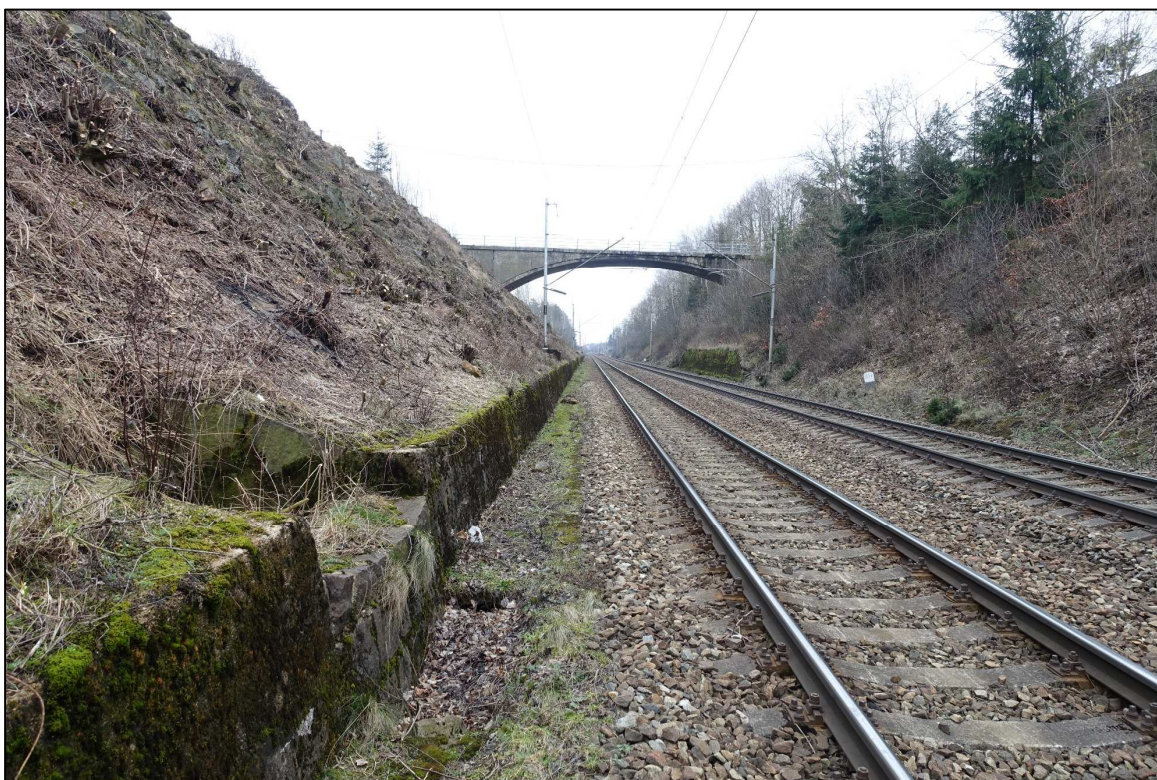
Obrázek 15 – Železniční zářez v km 91,600 s oboustrannými betonovými monolitickými zárubními zdmi, integrované žlaby odvodnění zaneseny, pohled ze směru Sázava u Ž.