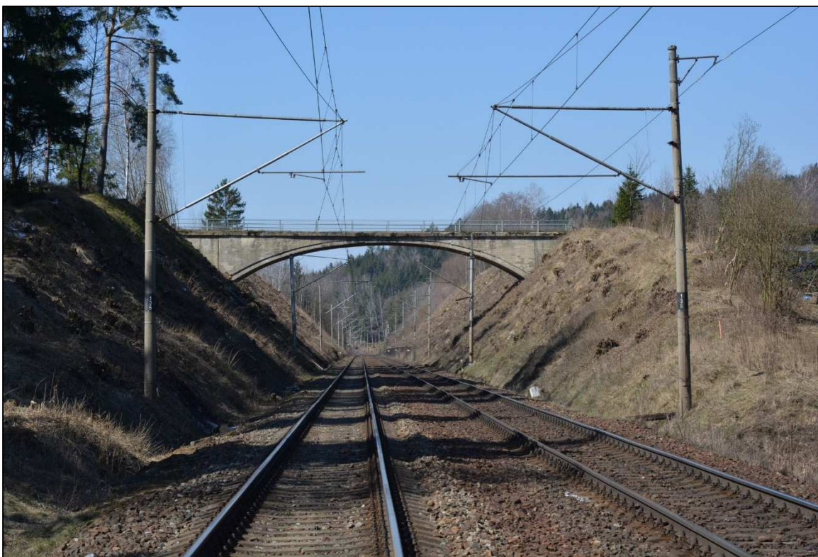
Obrázek 14 – Železniční zářez v km 91,400, pohled ze směru Žďár n. S.